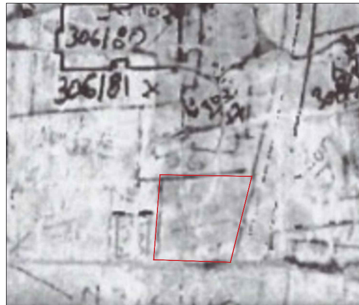
POZICIONI KADASTRAL, SHK. 1:1000