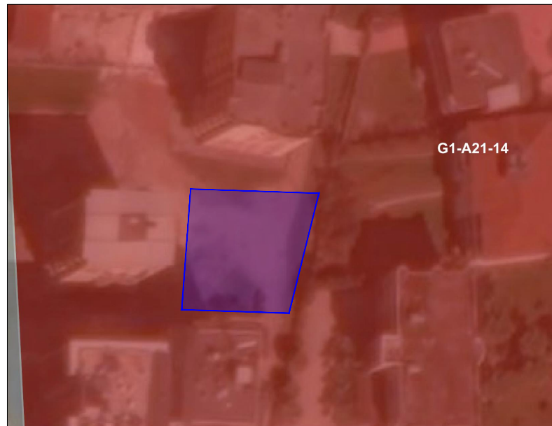
HARTA TOPOGRAFIKE SHK. 1:1000