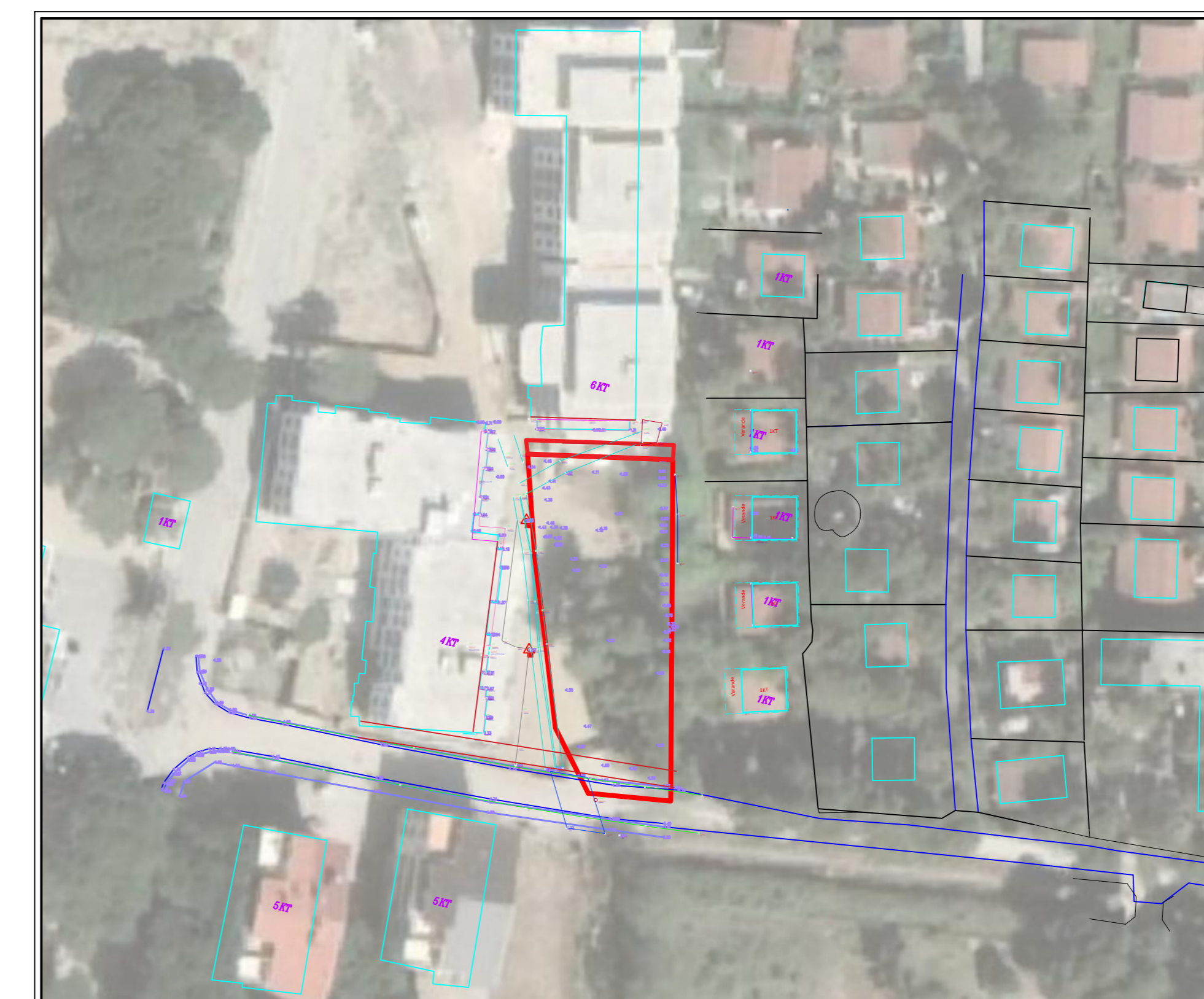
SKEMA E VENDOSJES SE ZONES QE ZHVILLOHET SHKALLA 1 : 1'000