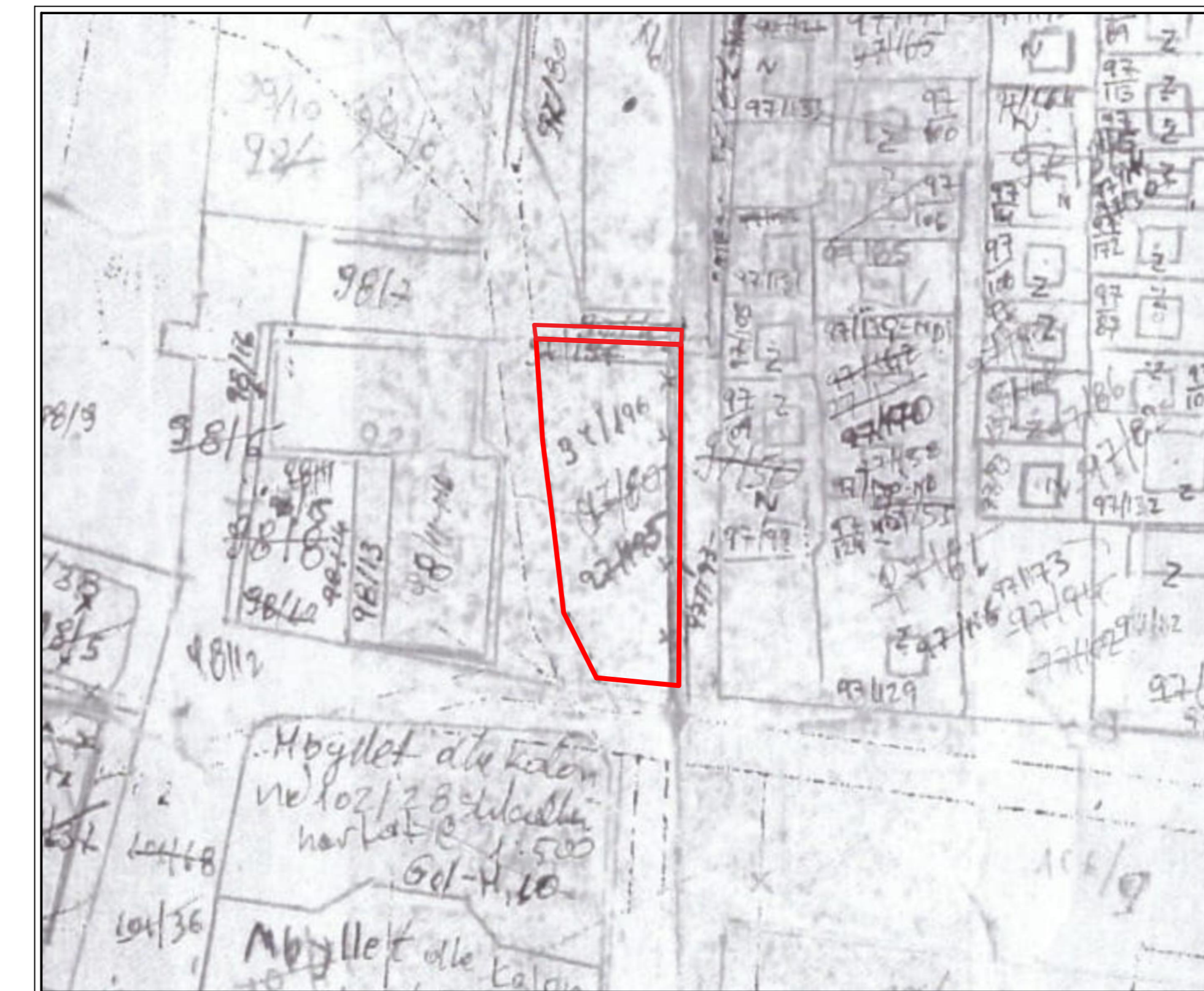
POZICIONI I KADASTRAL I PRONES SHKALLA 1 : 1'2'500