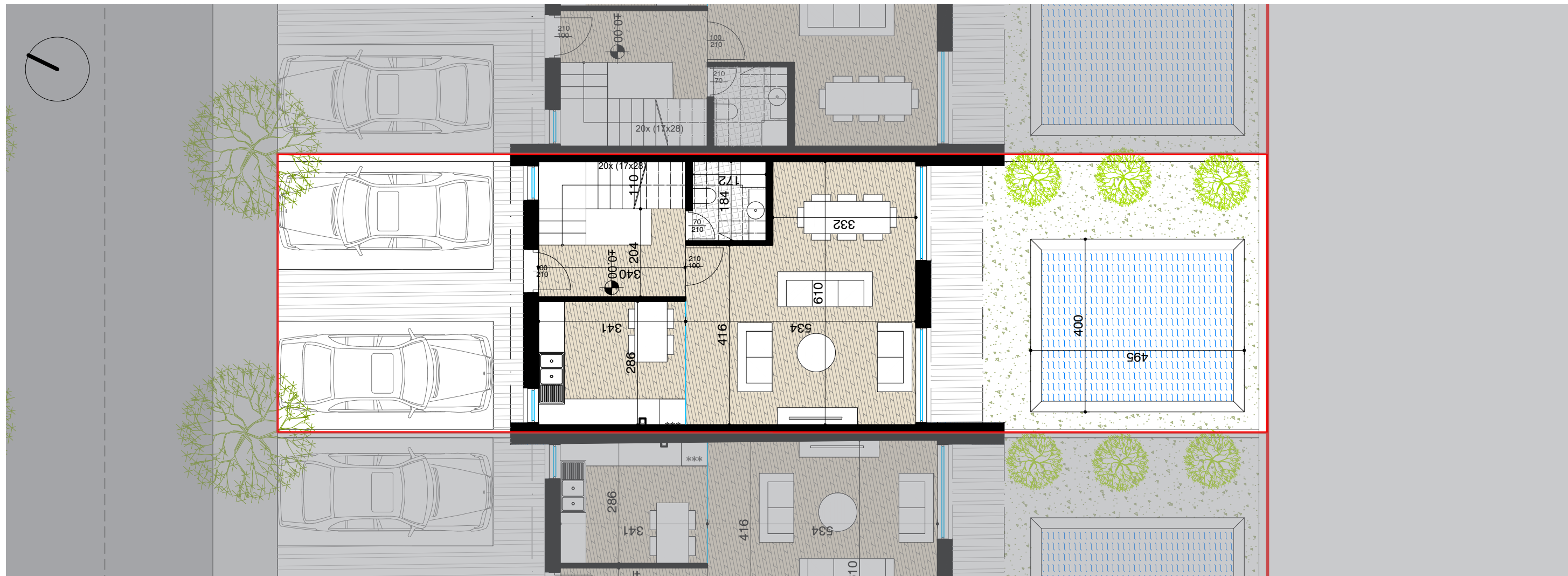
PLANIMETRI E KATIT PERDHE SH. 1:100