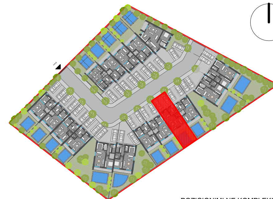
POZICIONIMI NE KOMPLEKS I VILES