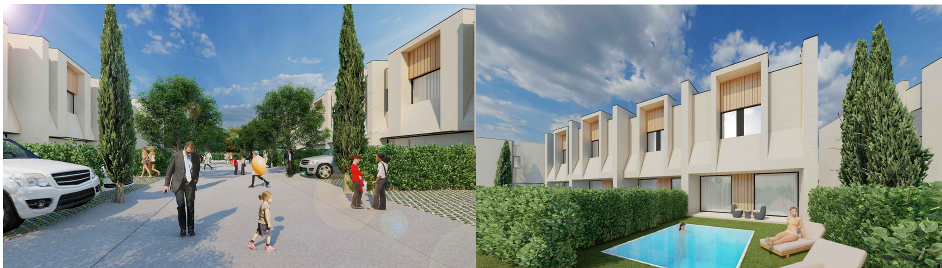
VILA nr. 9