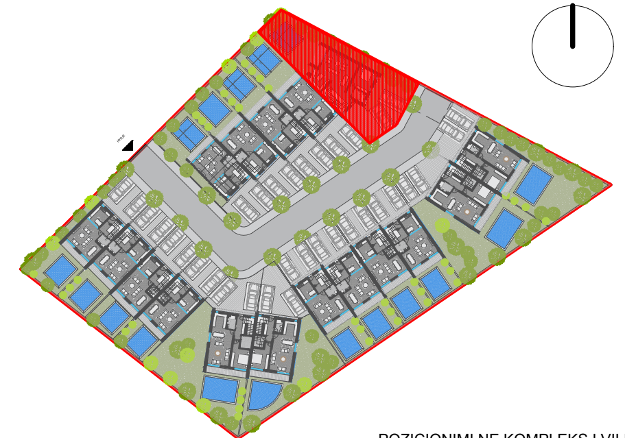
POZICIONIMI NE KOMPLEKS I VILES