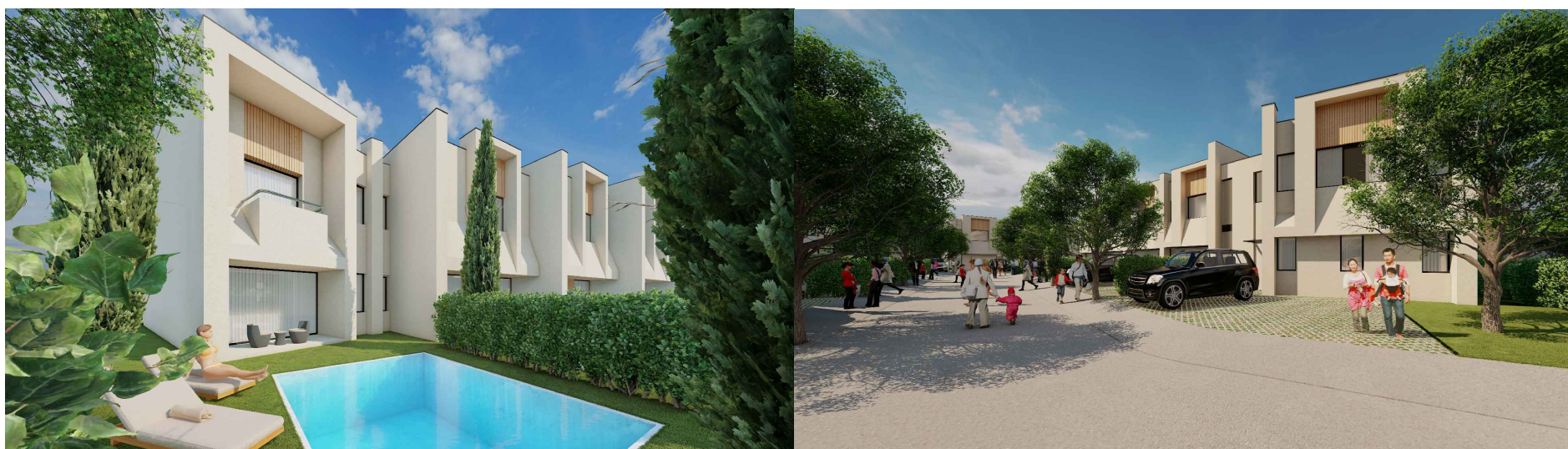
VILA nr. 5