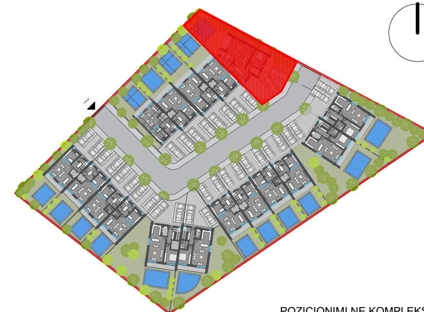
POZICIONIMI NE KOMPLEKS I VILES