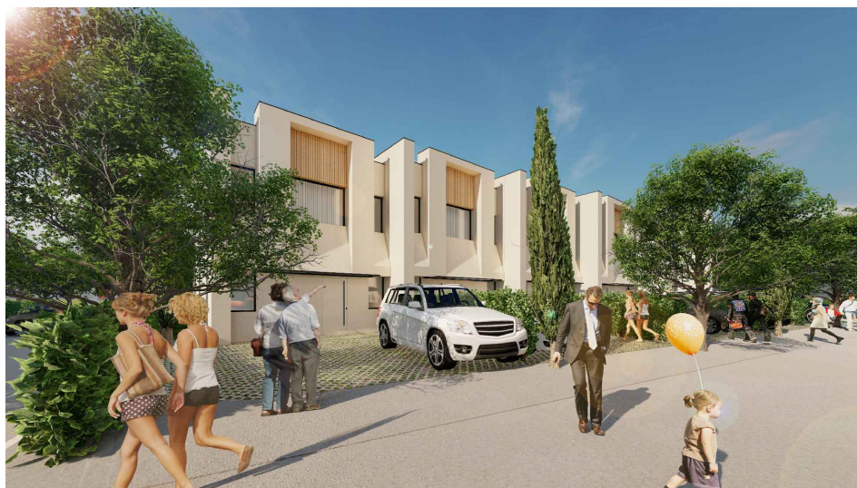
VILA nr. 4