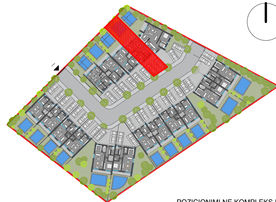
POZICIONIMI NE KOMPLEKS I VILES