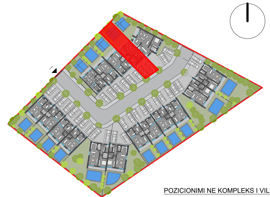
POZICIONIMI NE KOMPLEKS I VILES