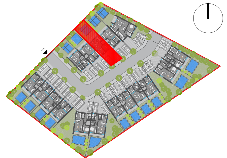
POZICIONIMI NE KOMPLEKS I VILES