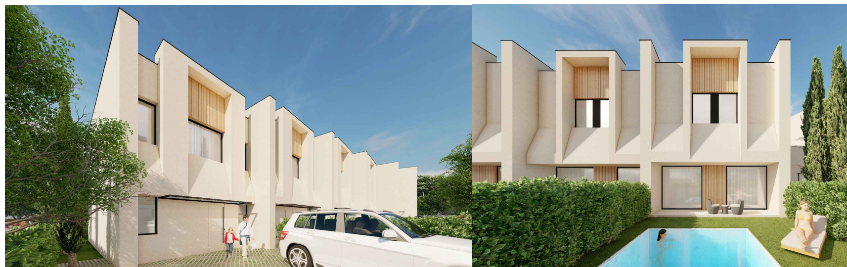
VILA nr. 3