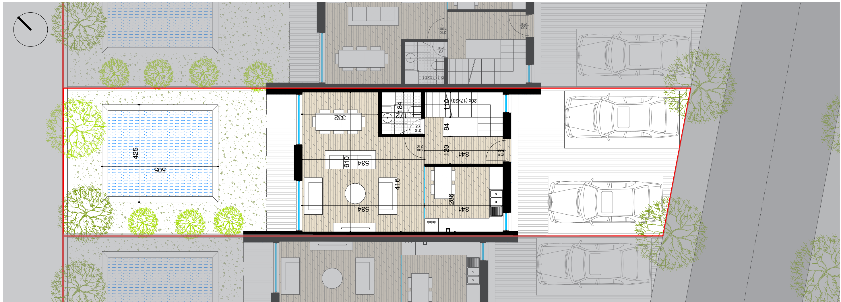
PLANIMETRI E KATIT PERDHE SH. 1:100