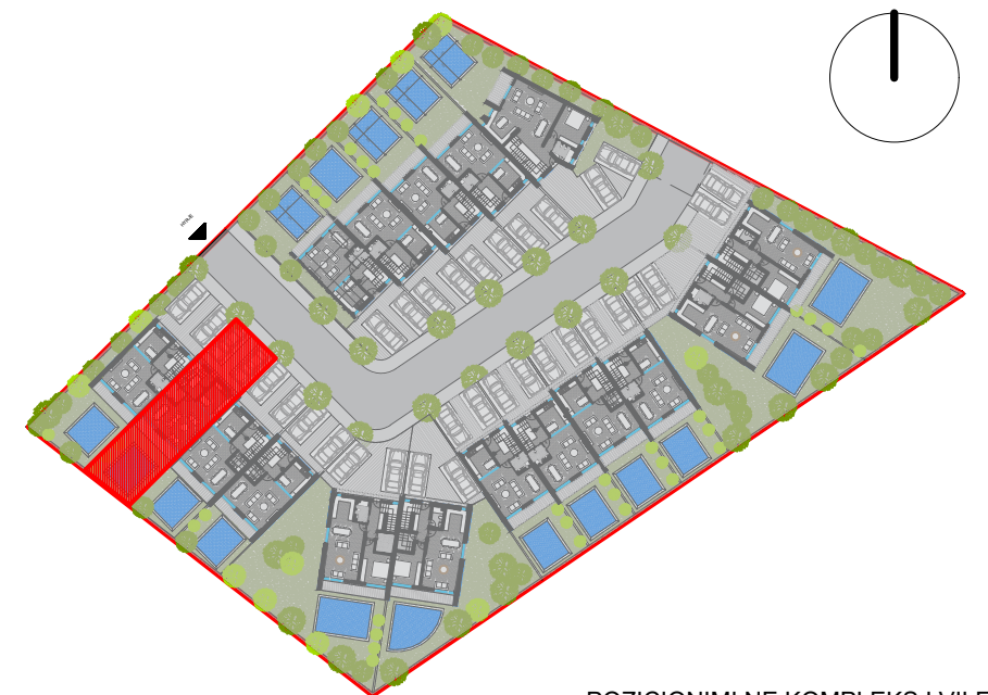
POZICIONIMI NE KOMPLEKS I VILES