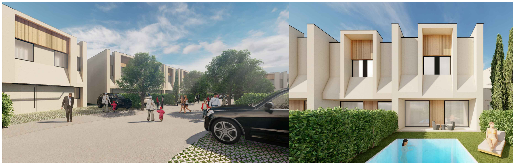
VILA nr. 16