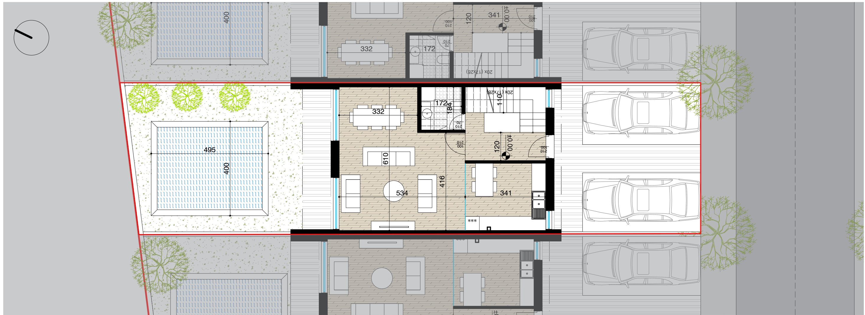
PLANIMETRI E KATIT PERDHE SH. 1:100