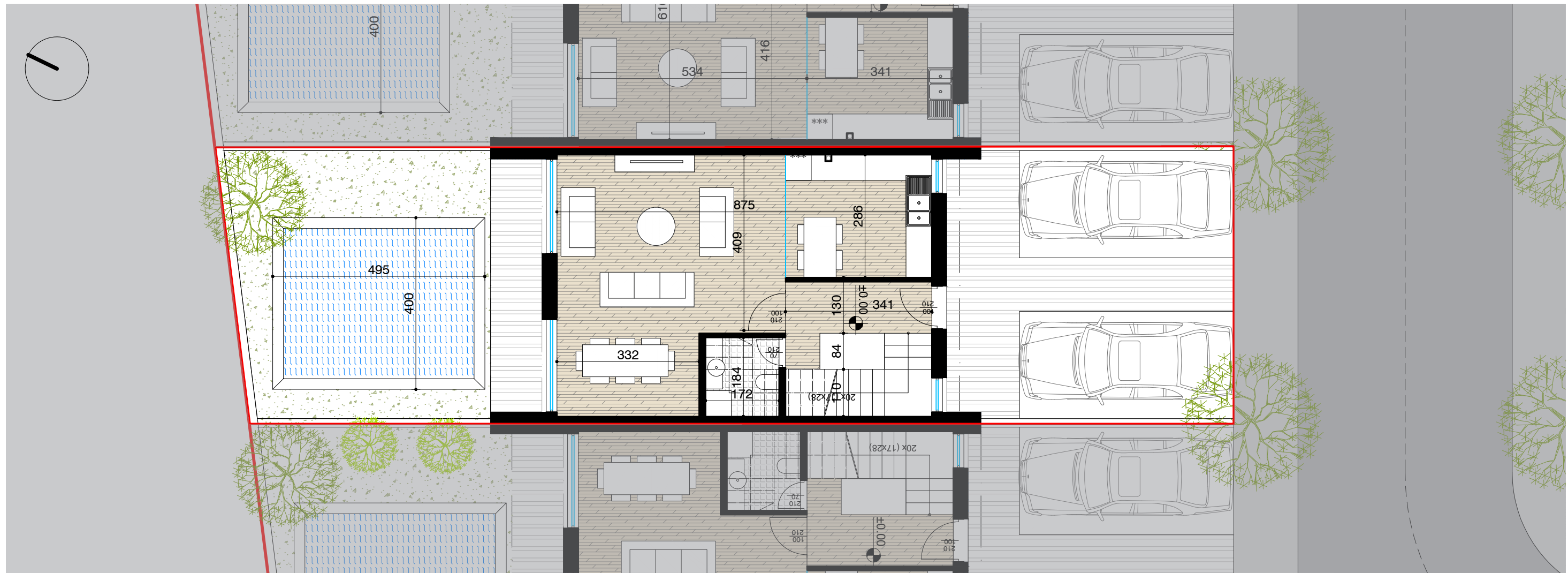
PLANIMETRI E KATIT PERDHE SH. 1:100