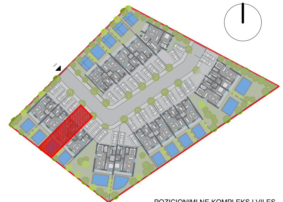
POZICIONIMI NE KOMPLEKS I VILES