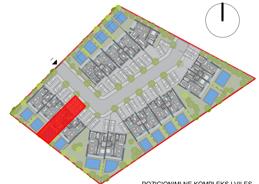
POZICIONIMI NE KOMPLEKS I VILES