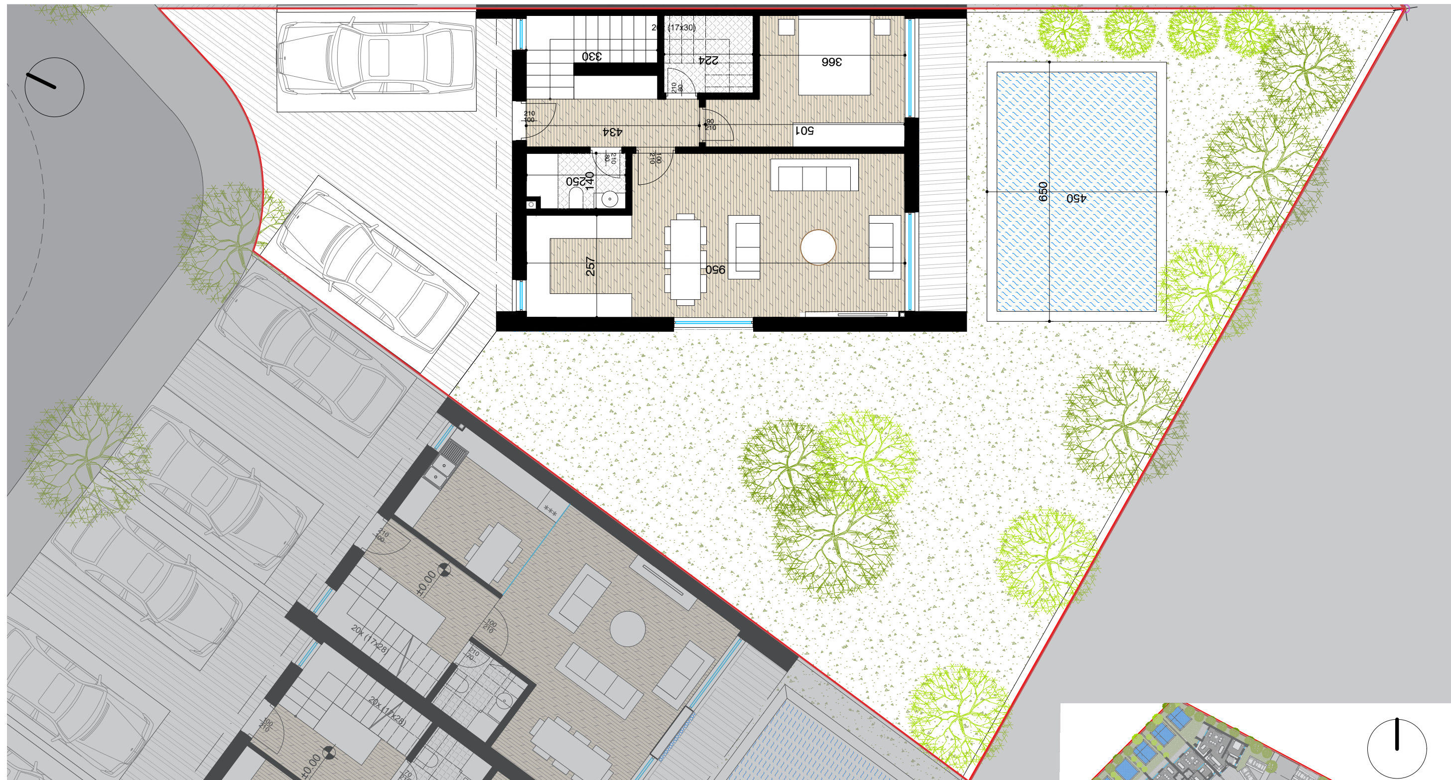
PLANIMETRI E KATIT PERDHE SH. 1:100