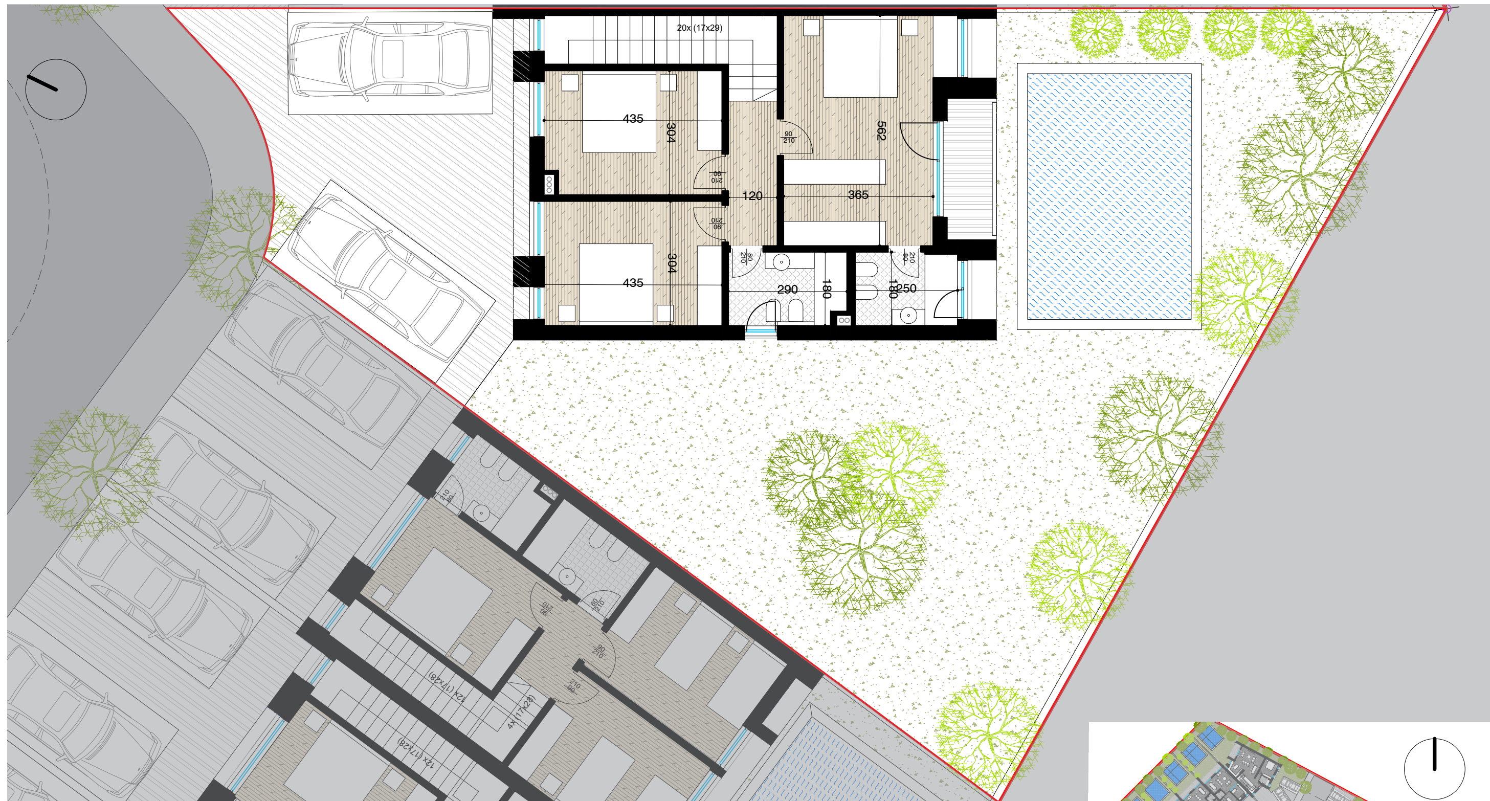
PLANIMETRI E KATIT TE PARE SH. 1:100