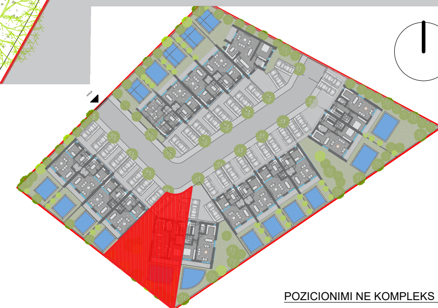
POZICIONIMI NE KOMPLEKS I VILES