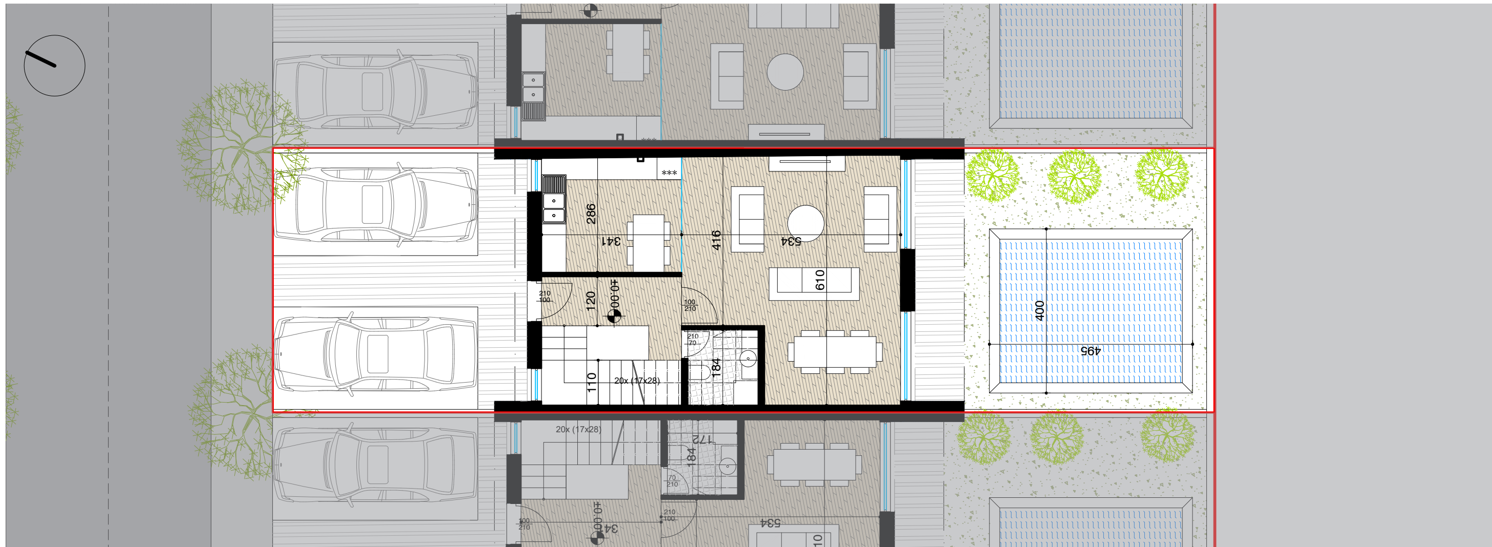
PLANIMETRI E KATIT PERDHE SH. 1:100