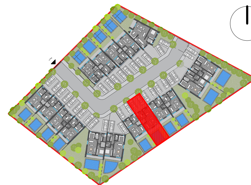
POZICIONIMI NE KOMPLEKS I VILES