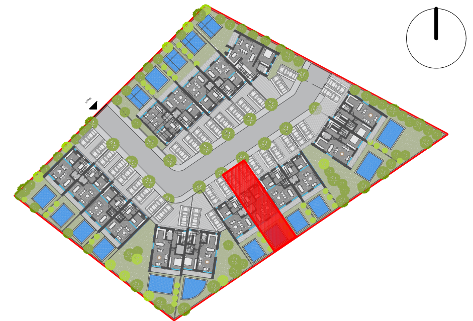
POZICIONIMI NE KOMPLEKS I VILES