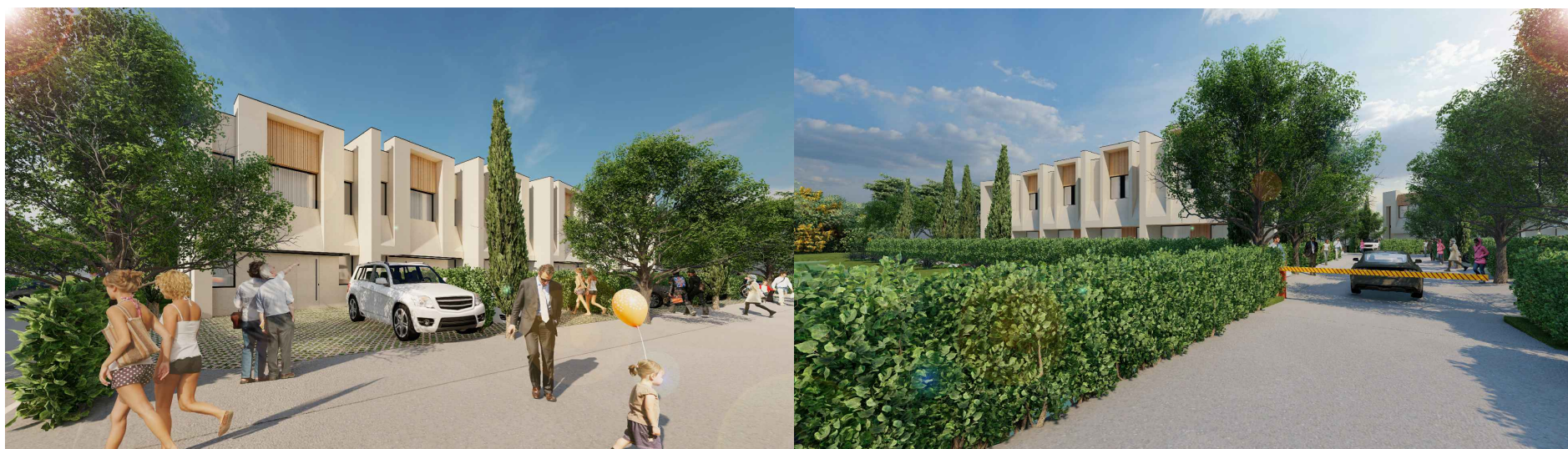
VILA nr. 1