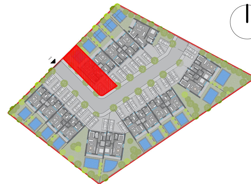
POZICIONIMI NE KOMPLEKS I VILES