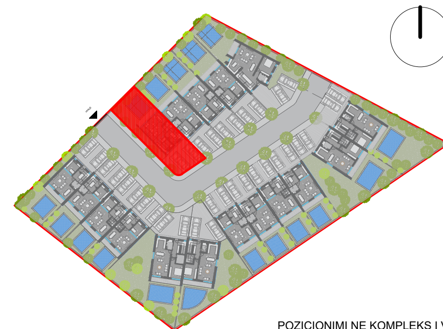
POZICIONIMI NE KOMPLEKS I VILES